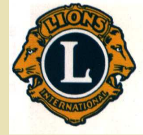
TABLEAU D'HONNEUR (suite)